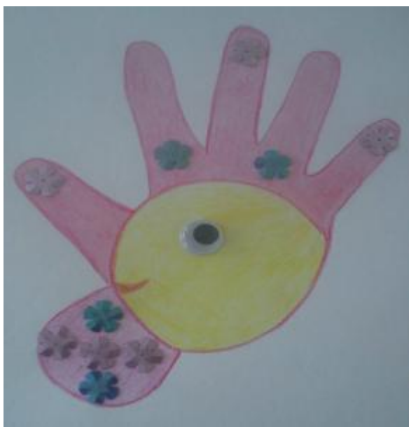
Петя – петушок