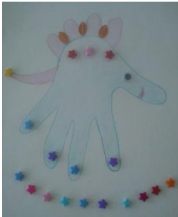
Рисунок № 6